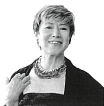
伊藤君子 いとうきみこ (ヴォーカル)

香川県小豆島生まれ。これまで17枚のアルバムを発売、数々の受賞歴に輝く日本を代表するジャズ・シンガー。活動の場は日本にとどまらず海外にも及ぶ。1989年にはソニー・ミュージックから発売されたアルバムがアメリカの「ラジオ&レコード誌」で16位にチャートインするという日本人初の快挙を成し遂げている。1997年には小曽根真とのデュオでスイス・モントルーの「モントルー・ジャズ・フェスティバル」に出演(ライブ録音盤が発売中)、2010年には、パリ、ローマ、セネガルで公演、その他にもヨーロッパ、アジア諸国で公演を行っている。最新アルバムは2017年5月に日本コロムビアより発売された「Kimiko sings HIBARI~伊藤君子、美空ひばりを歌う」。