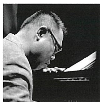
後藤浩二 ごとうこうじ (ピアノ)

香川県小豆島生まれ。これまで17枚のアルバムを発売、数々の受賞歴に輝く日本を代表するジャズ・シンガー。活動の場は日本にとどまらず海外にも及ぶ。1989年にはソニー・ミュージックから発売されたアルバムがアメリカの「ラジオ&レコード誌」で16位にチャートインするという日本人初の快挙を成し遂げている。1997年には小曽根真とのデュオでスイス・モントルーの「モントルー・ジャズ・フェスティバル」に出演(ライブ録音盤が発売中)、2010年には、パリ、ローマ、セネガルで公演、その他にもヨーロッパ、アジア諸国で公演を行っている。最新アルバムは2017年5月に日本コロムビアより発売された「Kimiko sings HIBARI~伊藤君子、美空ひばりを歌う」。