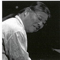
山本剛 やまもとつよし (ピアノ)

ジャズピアニストの父を持ち、幼少の頃より音楽に親しむ。早大モダンジャズ研究会在籍中に渡辺貞夫グループの正式メンバーに抜擢されてプロ入り。一躍スターの人気を博す。1971年にニューヨークへ渡り、巨匠ソニー・ロリンズのバンドに6年間在籍するほか、リー・コニツ、エルビン・ジョーンズなど数々のビッグアーティストと共演し「世界のマスオ」として活躍。70年代後半から、初めて組んだ自己のバンドで次々とヒットアルバムを制作。その人気を不動のものとする。感性のままナチュラルで伸びやかに歌うギター、幅広い表現力、その音楽性は懐が深い。現在もアメリカに拠点を置きながら日本でも精力的に演奏している。