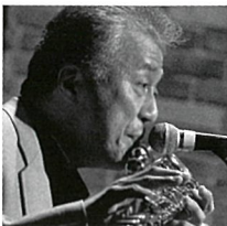
井上信平 いのうえしんぺい (フルート)

1948年3月23日、新潟県佐渡郡相川町に生まれる。すぐに佐渡島より新潟に移り、小学生の頃からピアノを弾き始める。1967年、日本大学在学中、19才でプロ入り。ミック・カーティスのグループを振り出しに英国～欧州各国を楽遊。1974年、レコードデビュー(「ミッドナイト・シュガー」TBM)。スケールの大きなブルース・フィーリングとスイングするピアノがファンの注目を集め、続く「ミスティ」(TBM)が大ヒット、以後レコード各社より数多くのアルバムを発表、人気ピアニストの地位を確立する。1977年、アメリカ、サンフランシスコ、モンテレー・ジャズ・フェスティバル出演。1979年、スイス、モントルー・ジャズ・フェスティバル出演。